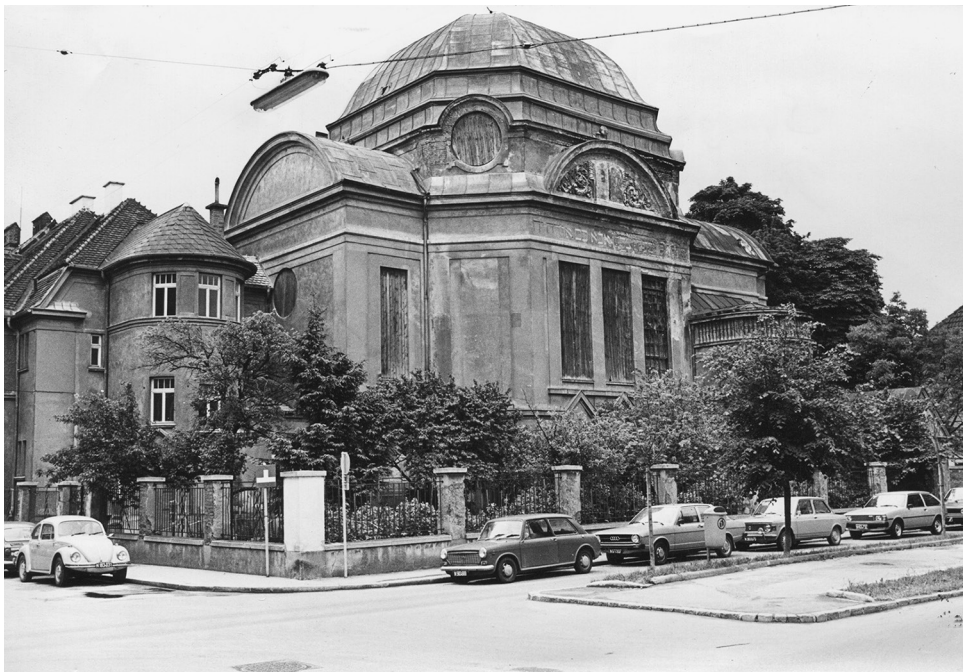
Im Kantorhaus der St. Pöltner Synagoge (links im Bild) war das „Referat für Fürsorge und Auswanderung“ der örtlichen IKG untergebracht. Die Abbildung stammt aus der Nachkriegszeit.

Anfang 1939 zeugten in vielen Städten der „Provinz“ nur noch die verwüsteten, verwaisten und „arisierten“ Synagogen vom jüdischen Leben. Die Kultusgemeinden waren weitgehend zerstört. Dort, wo es überhaupt noch Jüdinnen und Juden gab, wurden die äußerst bescheidenen, noch vorhandenen finanziellen und personellen Ressourcen zur Unterstützung der verbliebenen Mitglieder eingesetzt, um ein minimales Gemeindeleben aufrechterhalten zu können. Neben der Auszahlung kleinerer Summen für den Lebensunterhalt bestand die Hilfe vor allem in der Organisation der „Auswanderung“. Im Kantorhaus der St. Pöltner Synagoge hatte die IKG beispielsweise bald nach dem „Anschluss“ ein „Referat für Fürsorge und Auswanderung“ eingerichtet. Finanziert wurde