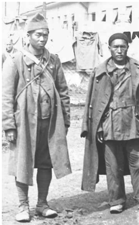
Abb. 15 (oben) und 16 (rechts): Französische, aus Indochina stammende Kriegsgefangene im Stalag XVIIA