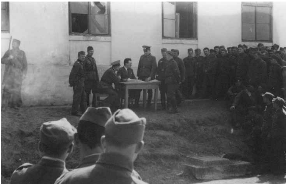
Abb. 8: Registrierung polnischer Kriegsgefangener, April 1940