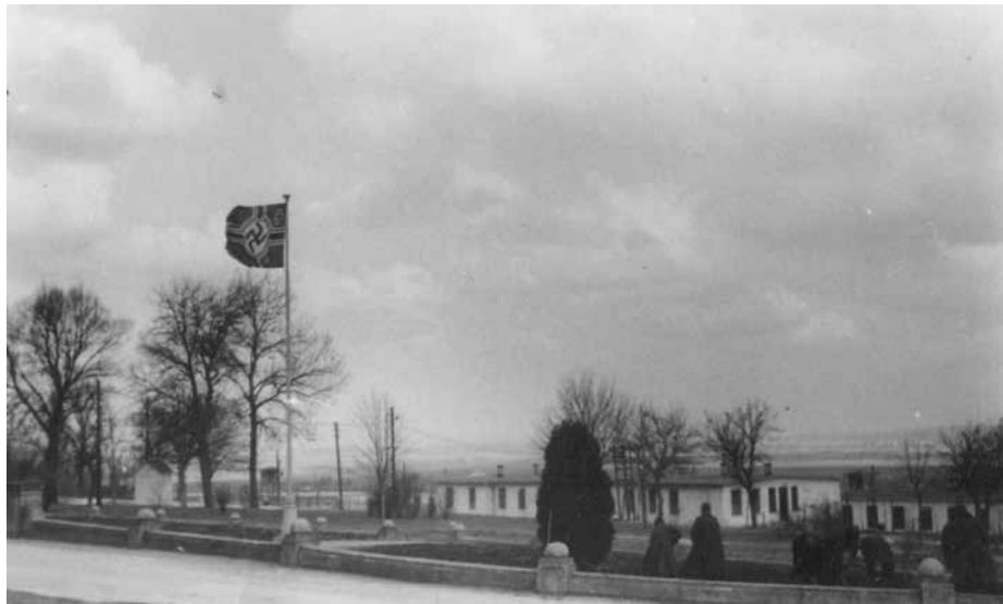
Abb. 2 und 3: Ansichten des Kriegsgefangenenlagers in Kaisersteinbruch