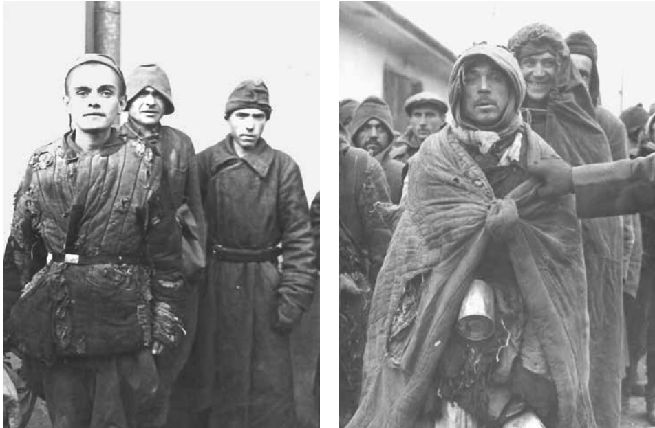
Abb. 22 und 23: Sowjetische Kriegsgefangene