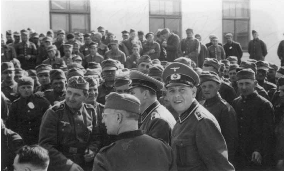
Abb. 7: Ankunft polnischer Kriegsgefangener, April 1940