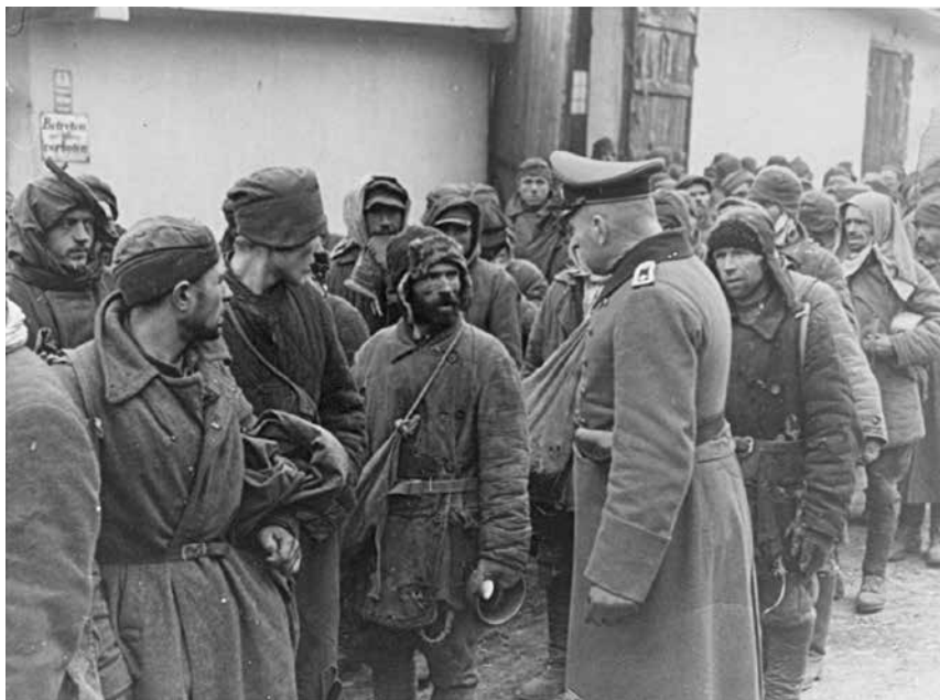
Abb. 25: Sowjetische Kriegsgefangene

Diese bildlich-kompositorischen Parallelen sagen zwar nichts über die Beweggründe des unbekanntem Fotografen aus, lassen aber den Schluss zu, dass sich die von der nationalsozialistischen Ideologie und Propaganda geschaffenen visuellen Stereotypen in den Köpfen der Menschen in hohem Ausmaß verfestigt hatten – und ihre Wirkung auch nach 1945 noch entfalten konnten.