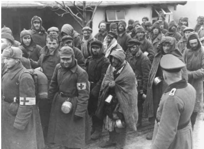
Abb. 24: Sowjetische Kriegsgefangene

Die Fotos, die der unbekannte Fotograf von den sowjetischen Gefangenen im Lager Kaisersteinbruch anfertigte, ähneln von der visuellen Gestaltungsweise her den Fotos der Propagandakompanien auf verblüffende Weise. Wie die Fotografen der Propagandakompanien inszeniert auch der unbekannte Fotograf in Kaisersteinbruch die Fotos der sowjetischen Kriegsgefangenen, indem er besonders elend aussehende Gefangene (Fotos Nr. 20, 21, 22, 23) zentral ins Bild setzte bzw. im wahrsten Sinn des Wortes auf eine lange Reihe sowjetischer Kriegsgefangener herabblickte, indem er sie von einem erhöhten Standpunkt aus als wimmelnde Menge aufnahm (Foto Nr. 24). Wie die französischen Soldaten der Kolonialtruppen sind auch die sowjetischen Kriegsgefangenen der Kamera wehr- und hilflos ausgeliefert – auf dem Foto Nr. 22 ist sogar ein Arm zu sehen ist, der einen Gefangenen zum Fotografieren festhält – und scheinen auf Grund ihrer elenden Verfassung die rassistischen Stereotype des „kulturlosen und rassistisch minderwertigen Sowjetsoldaten“ zu bestätigen. Ähnlich den Propagandakompaniefotografen, die Fotos einzeln aufgenommener sowjetischer Soldaten zu Portraits angeblicher „sowjetischer Verbrechertypen“ stilisierten, fertigte auch der unbekannte Bildautor in Kaisersteinbruch Einzelaufnahmen sowjetischer Kriegsgefangener an.