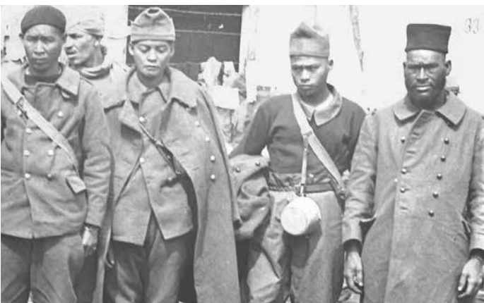
Abb. 13 (links oben) und 14 (links unten): Inszenierung des „Exotischen“: Aus den französischen Kolonialgebieten stammende Soldaten im Stalag XVIIA