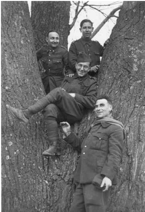
Abb. 10 (oben): Belgische Kriegsgefangene

Nr. 11 ist mit 29. 3. 1941 datiert und mit der Beschriftung „Belgier, Franzosen“ versehen. Auf allen drei Fotos lächeln die Kriegsgefangenen, eine Tatsache, die einerseits darauf hindeutet, dass ihr Schicksal als Angehörige eher privilegierter Gefangenennationen erträglich war, und andererseits, dass sie sich trotz widriger Umstände an einen für sie wichtigen Lebensabschnitt erinnern wollten. Dass auf Foto Nr. 9 auch ein Angehöriger der Wehrmacht abgebildet ist, lässt vermuten, dass die Behandlung der Kriegsgefangenen der westlichen Nationen im Stalag XVIIIA im Wesentlichen korrekt war.