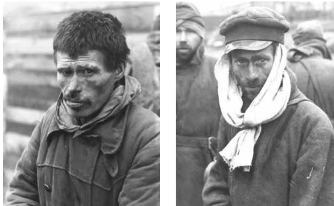
Abb. 20 und 21: Sowjetische Kriegsgefangene

Ein schwarzer Soldat schien das Interesse des Fotografen besonders geweckt zu haben, da er von diesem nicht nur in einer Gruppe (Foto Nr. 17) Gefangener, sondern auch isoliert von den anderen fotografiert wurde (Foto Nr. 18). Möglicherweise wurde der unbekannte Fotograf zu diesen Fotos, die so augenfällig das „Exotische“ und „Fremde“ demonstrieren und die rassistischen Vorurteile, mit denen dunkelhäutige Menschen seit dem Zeitalter des Kolonialismus konfrontiert waren, zumindest erahnen lassen, von den anthropologischen Untersuchungen des Naturhistorischen Museums inspiriert. Das Kriegsgefangenenlager hatte den Wiener Anthropologen nicht nur ein reiches, sondern auf Grund der Wehrlosigkeit des „Kriegsgefangenenmaterials“ 36 auch ein einfach zu bearbeitendes Betätigungsfeld eröffnet, da sie „in der militärischen Disziplin [...] große Vorteile gegenüber den Schwierigkeiten, die bei zivilen Untersuchungen auftraten“ 37 erkannten. So wurden zwischen 1940 und 1943 an insgesamt 5155 Kriegsgefangenen anthropologische Untersuchungen – u. a. Hand- und Fingerabdrücke, Ganzkörpermaße, Gesichts- und Ganzkörperfotos, Haarproben – vorgenommen, und zwar nicht nur an Angehörigen der französischen Kolonialtruppen, sondern auch an „Polen, Flamen, Franzosen, Bretonen, Normannen [sic!]“ 38 und ab 1943 auch an den „Vertretern von Völkern der Sowjetunion, insbesondere von Turkvölkern, Kaukasiern und Mongoloiden [sic!]“. 39