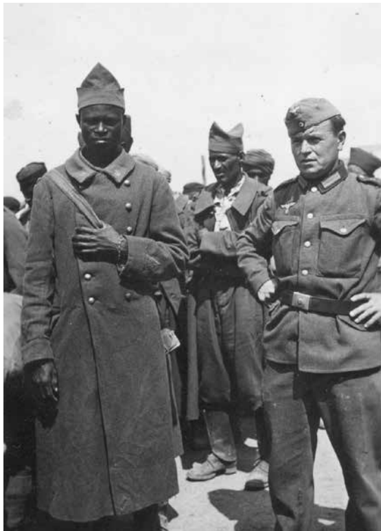
Abb. 17 (oben), 18 (unten) und 19 (links): Angehörige der französischen Kolonialtruppen