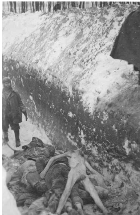
Von links oben im Uhrzeigersinn Abb. 4, 5 und 6: Im Winter 1941/42 wurde in Sommerein ein Gefangen- friedhof angelegt, wo die Toten in Massengräbern verscharrt wurden.