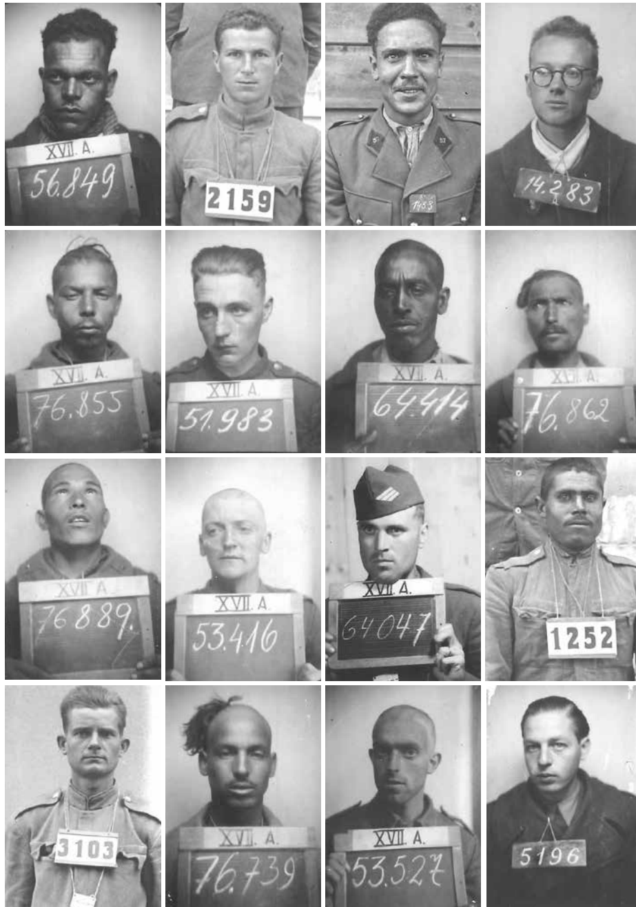
Abb. 1: Kriegsgefangene im Stalag XVIIA